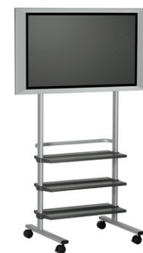
※ディスプレイ取付イメージ (PB175)