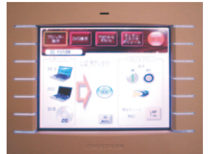
8.4インチ ワイヤレスタッチパネル + ドッキングステーション

タッチパネルは写真左のような無線LAN対応のカラー表示タイプ、部屋の中であればどこにいてもコントロールが可能です。プロジェクターやスイッチャーなども各機材に応じた制御方法で対応できます。また、ワイヤレスタイプでなく写真右のような埋め込みタイプもご用意できます。