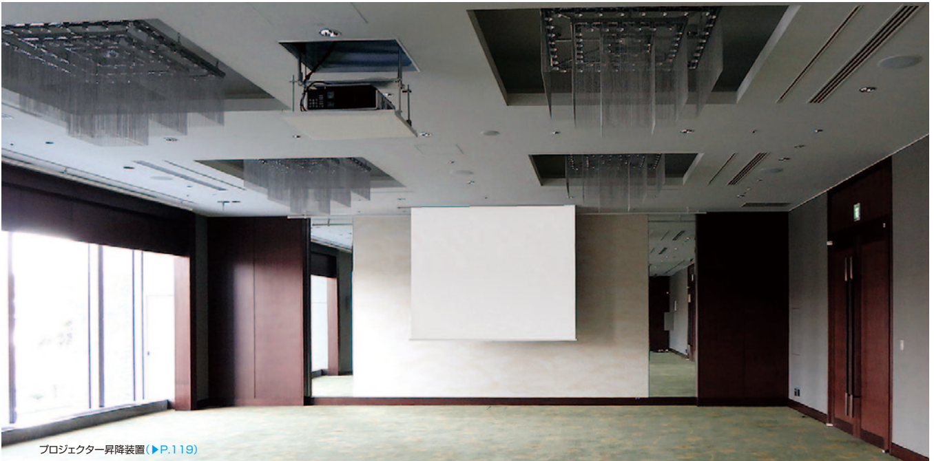
プロジェクター昇降装置(▶P.119)