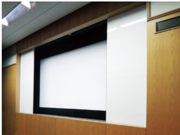
薄型ディスプレイの収納も可能です。

白板 (黒板) や化粧扉を開閉させ、内側にスクリーン等を設置させるシステムです。ウォールバックのように、壁面と一体化させる必用の無い場合に採用します。