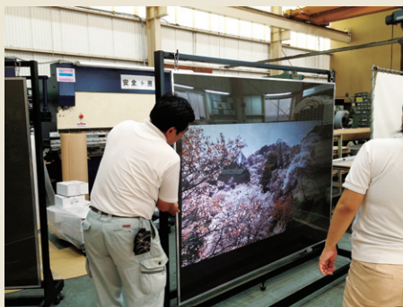
大型リアプロジェクションフィルム

商品化となるモバイルソーラーユニットの生産・発売を開始しました。オーエスエムは、お客様のご意見・ご要望を積極的に取り入れた自社商品開発に取り組んでまいります。また、お客様の委託生産や商品開発のお手伝いにも対応してまいります。