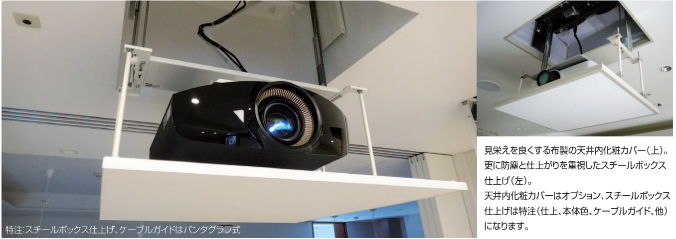
特注: スチールボックス仕上げ、ケーブルガイドはハンタグラフ式

見栄えを良くする布製の天井内化粧カバー(上)。更に防塵と仕上がりを重視したスチールボックス仕上げ(左)。天井内化粧カバーはオプション、スチールボックス仕上げは特注(仕上、本体色、ケーブルガイド、他)になります。