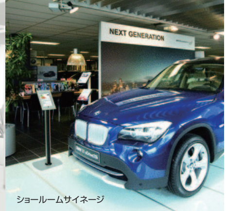
ショールームサイネージ