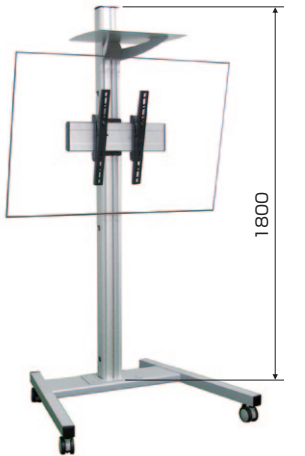
DSC-46F (46型ディスプレイ設置イメージ)