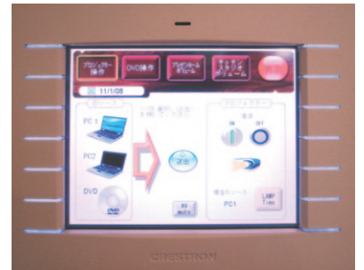
8.4インチ ワイヤレスタッチパネル + ドッキングステーション

タッチパネルは写真左のような無線LAN対応のカラー表示タイプ、部屋の中であればどこにいてもコントロールが可能です。プロジェクターやスイッチャーなども各機材に応じた制御方法で対応できます。また、ワイヤレスタイプでなく写真右のような埋め込みタイプもご用意できます。