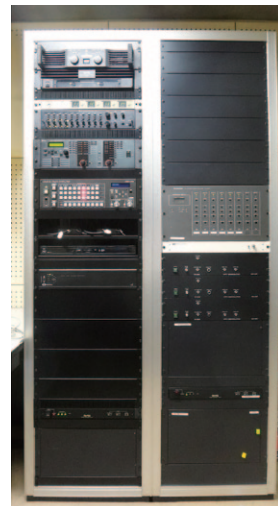
価格はずべてオープンです。

操作システムを見直し、タッチパネル操作に変更。不要な機材が入っていたラックは元々4連のものから2連へと変更。既存の音響設備はそのまま使用しつつ、スイッチャーなどの映像設備を主に更新しています。