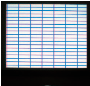
平面性の高いスクリーン (SZP)

短焦点プロジェクターは、スクリーンの至近距離から投写するために、打ち込み角度が大きくなり、そのためスクリーンの僅かなたるみでも大きなゆがみとして現れてしまいます。