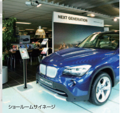
ショールームサイネージ