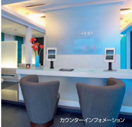
カウンターインフォメーション

TabLockは、iPad用のセキュリティケース [PTS1105]、ケース+テーブルスタンドのセット [PTS1105-S1]、ケース+フロアスタンドのセット [PTS1105-S2] の3種類から、用途に合わせてお選びいただけます。iPadアプリを利用することで、レストラン等でのオーダーシステム、ショールームのインフォメーション、アンケート、受付など、多様なシーンで無人端末管理ケースとして活用いただけます。