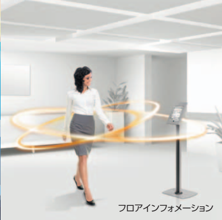
フロアインフォメーション