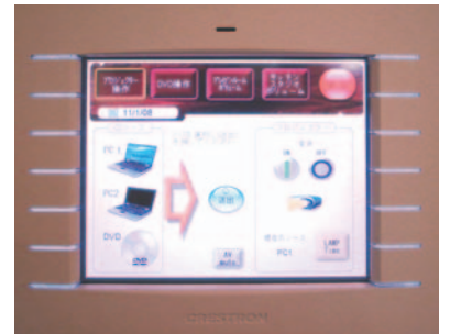
8.4インチ ワイヤレスタッチパネル + ドッキングステーション

タッチパネルは写真左のような無線LAN対応のカラー表示タイプ、部屋の中であればどこにいてもコントロールが可能です。プロジェクターやスイッチャーなども各機材に応じた制御方法で対応できます。また、ワイヤレスタイプでなく写真右のような埋め込みタイプもご用意できます。