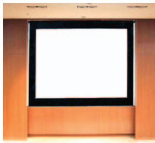
映像投写ができます。