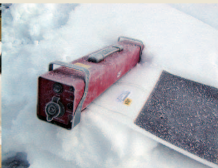
モバイルソーラー耐久テスト