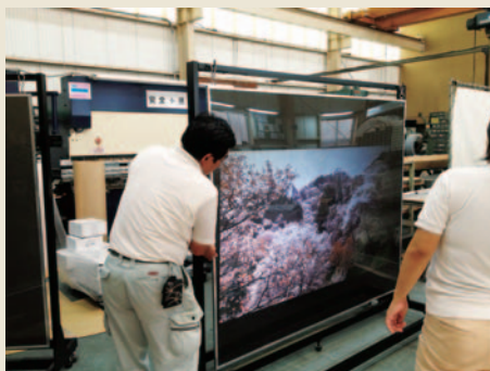
大型リアプロジェクションフィルム

商品化となるモバイルソーラーユニットの生産・発売を開始しました。オーエスエムは、お客様のご意見・ご要望を積極的に取り入れた自社商品開発に取り組んでまいります。また、お客様の委託生産や商品開発のお手伝いにも対応してまいります。