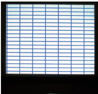
平面性の高いスクリーン (SZP)

超短焦点 / 短焦点プロジェクターは、スクリーンの至近距離から投写するために、打ち込み角度が大きくなり、そのためスクリーンの僅かなたるみでも大きなゆがみとして現れてしまいます。