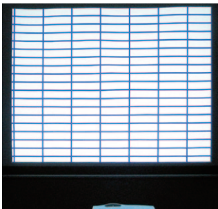
一般的な巻取りスクリーン