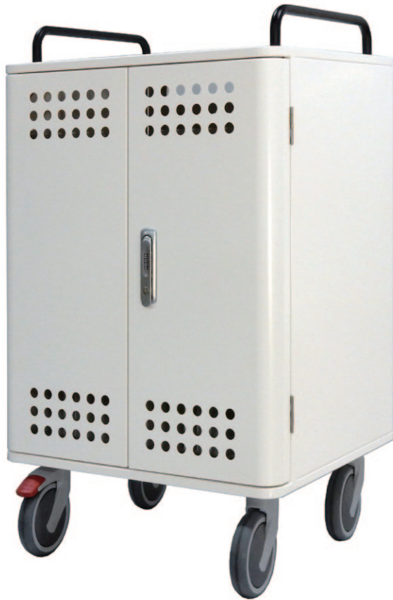
写真はφ150の大型キャスター(オプション)装着時