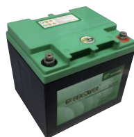
シリコンバッテリー