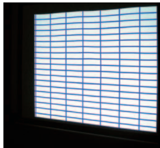
一般的な巻取りスクリーン

超短焦点 / 短焦点プロジェクターにお使いになるスクリーンを選定する際には、平面性の高いスクリーンをお選びください。ゆがみを気にすることなく、快適に映像をご覧ください。なおオーエスの超短焦点対応スクリーンには、右記の推奨マークを表示いたしました。スクリーンご選定の際の目安にしてください。