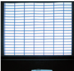
一般的な巻取りスクリーン