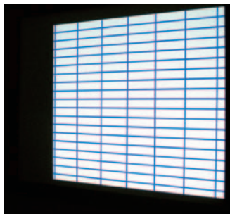
平面性の高いスクリーン (SZP)