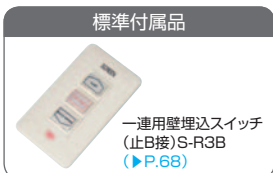
一連用壁埋込スイッチ (止B接)S-R3B (P.68)