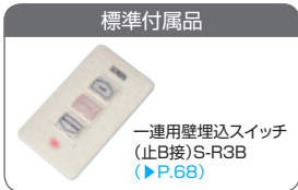
一連用壁埋込スイッチ (止B接)S-R3B (P.68)