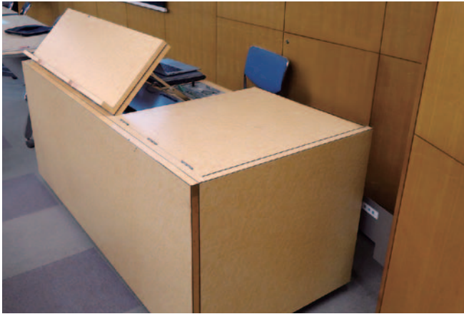
既存レクチャー卓