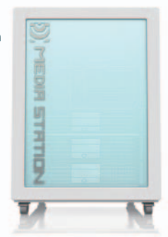
メディアステーション