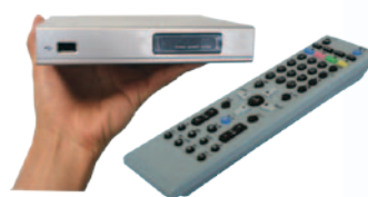
メディアプレーヤーとリモコン