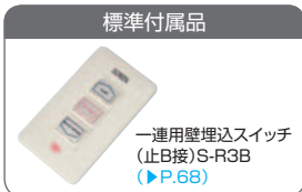
一連用壁埋込スイッチ (止B接)S-R3B (P.68)