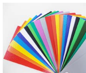
本体カラーバリエーション (豊富な色から選べます)