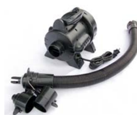
エアーポンプ (標準付属品HT-302)