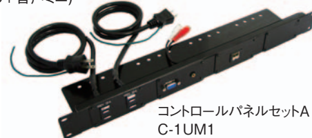
コントロールパネルセットA C-1UM1