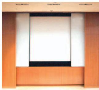
スクリーンが現れ