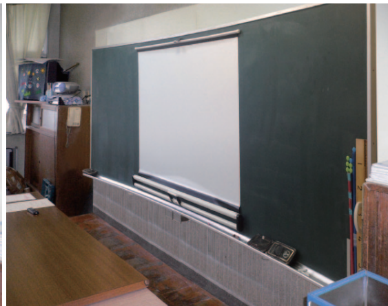
左:EEU-3612B1本体(黑板取付前) 上:曲面黑板取付時 弊社WSM-070WC-MV2 マグネットスクリーン取付状態