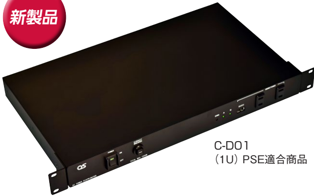
C-D01 (1U) PSE適合商品