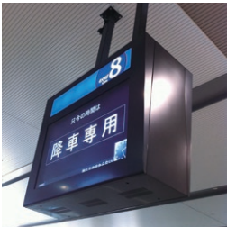
半屋外筐体:交通案内