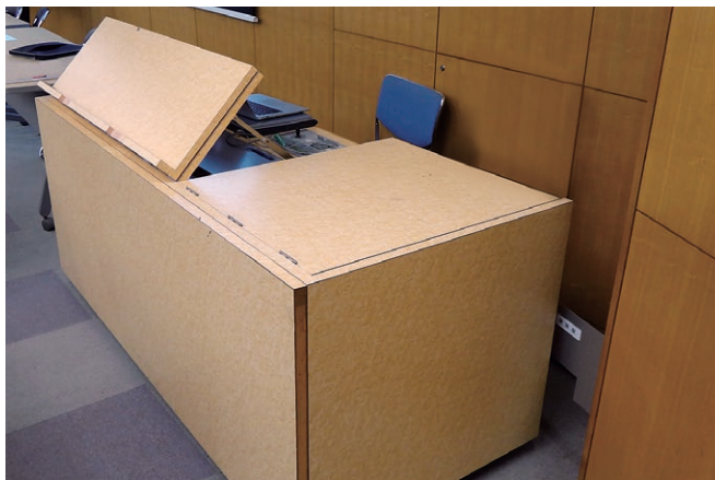
既設レクチャー卓