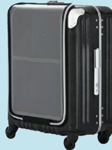
スーツケース用 ソーラー