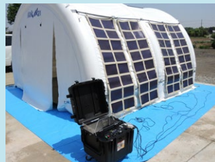
ソーラーエアテント