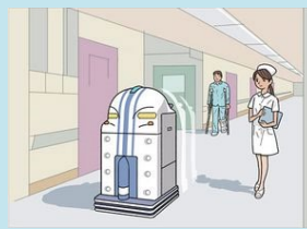
AGV (自動搬送機) 用バッテリーパック