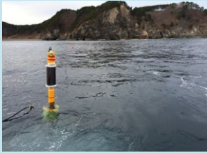
海洋ブイ用ソーラー