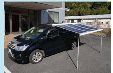
ソーラーカーオーニング