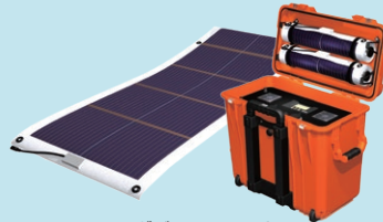
フローティングバッテリーセット