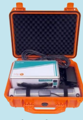
モバイルバッテリー 防水セット