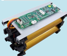
12V/20Ahバッテリーパック