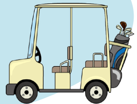
ゴルフカート用バッテリーパック