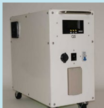
1.5kwバッテリーユニット