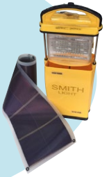
スミスライト用 ソーラー