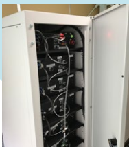
30kwバッテリーユニット