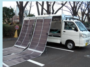
ソーラー浄水コンテナ