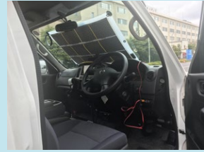
カーフロントガラス用ソーラー