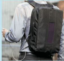
バック用ソーラー