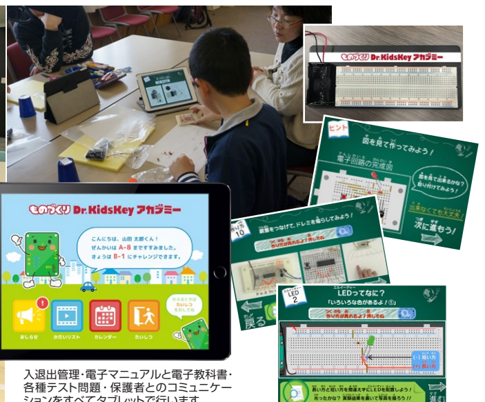
入退管理・電子マニュアルと電子教科書・各種テスト問題・保護者とのコミュニケーションをすべてタブレットで行います。