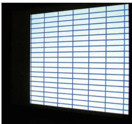
平面性の高いスクリーン (SZP)