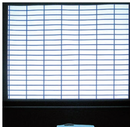
一般的な巻取りスクリーン