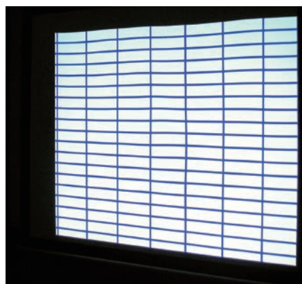
一般的な巻取りスクリーン

超短焦点/短焦点プロジェクターにお使いになるスクリーンを選定する際には、平面性の高いスクリーンをお選びください。ゆがみを気にすることなく、快適に映像をご覧ください。なおオーエスの超短焦点対応スクリーンには、右記の推奨マークを表示いたしました。スクリーンご選定の際の目安にしてください。