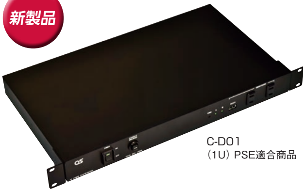
C-D01 (1U) PSE適合商品