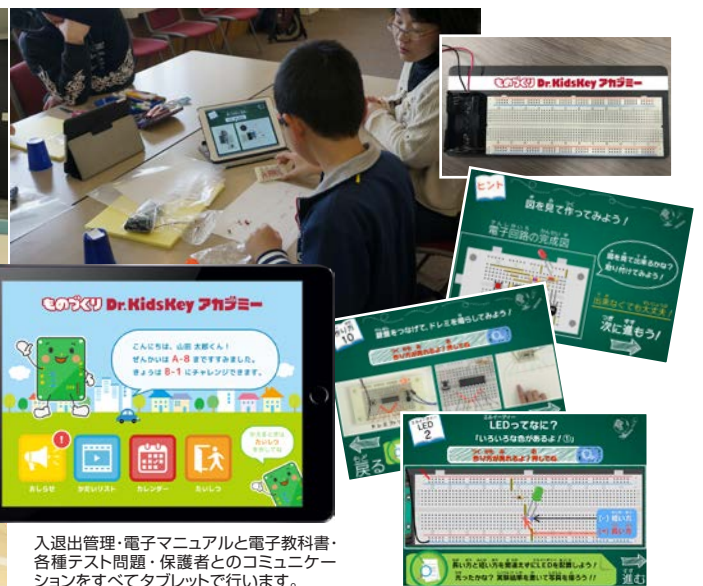
入退室管理・電子マニュアルと電子教科書・各種テスト問題・保護者とのコミュニケーションをすべてタブレットで行います。