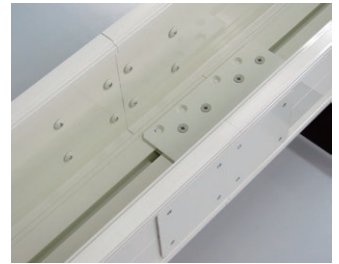
ジョイント部をすらし、本体強度を確保しています。

従来品の一体型(カット無し)のアルミボックスと併せ、ジョイント式のAL-○○○EX(X)-Jをお選びいただき、今までクレーンで運び上げていた高層階や奥行きが無い搬入口など、取り回しの困難な現場でご活用ください。