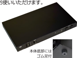
本体底部には ゴム足付

脱着型EIA金具 (1U) 卓上で使用する場合には、金具を外し、すっきりとした形でお使いいただけます。