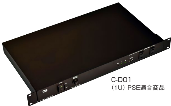
C-D01 (1U) PSE適合商品