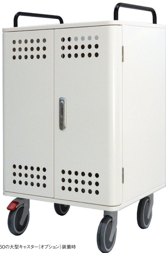
写真はφ150の大型キャスター(オプション)装着時

Apple iPadを始め、多数の12.5インチタブレット端末などを最大40台同時に保管と充電ができる収納キャビネットです。ゆったりサイズで様々なタブレットに対応、充実したオプションで使いやすくなったカート。