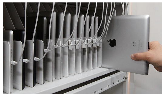
1段に20台のタブレットを保管。それぞれにACコンセントを装備。