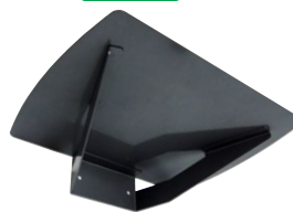
下方から見た棚板