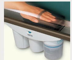
サイクロン式 電動ラーフルクリーナー