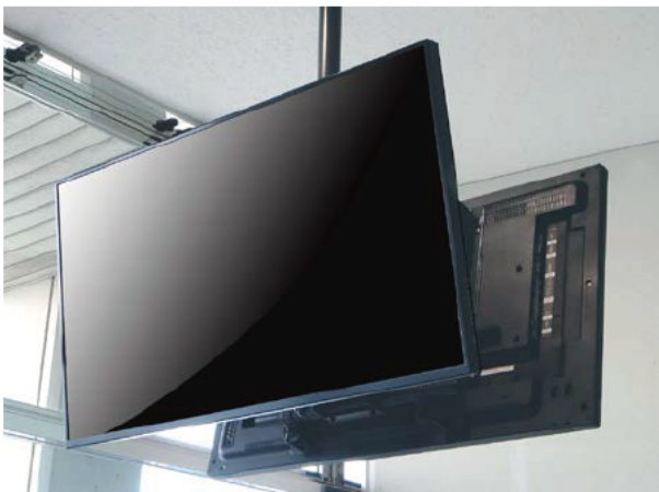
ディスプレイ横設置