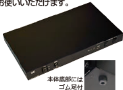
本体底部には ゴム足付