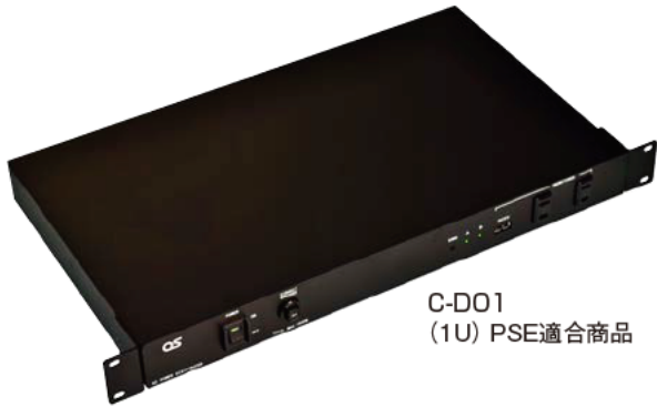
C-D01 (1U) PSE適合商品