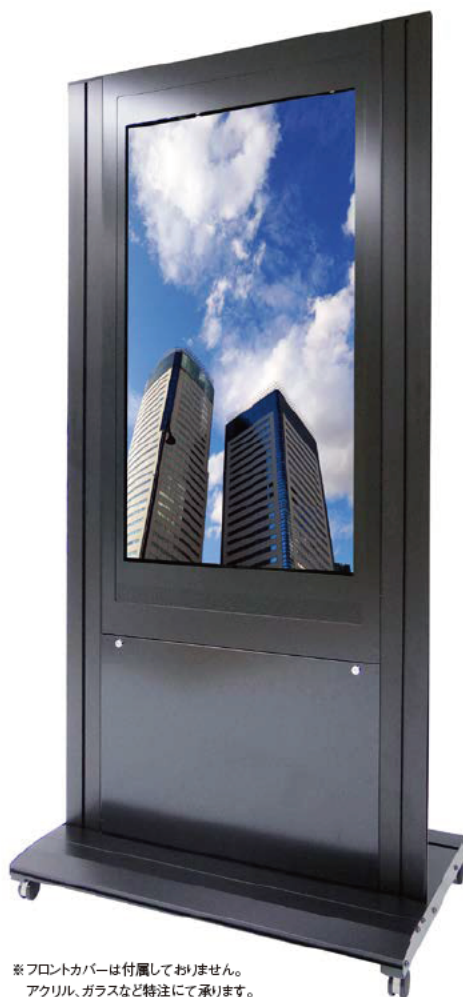
※フロントカバーは付属しておりません。 アクリル、ガラスなど特注にて承ります。