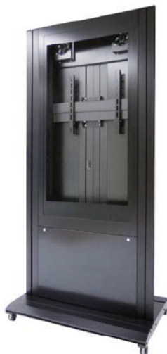
シンプルな背面。 ケーブルは柱内部で処理。