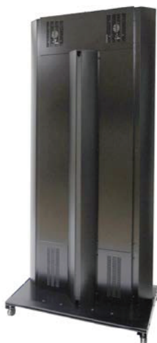
ディスプレイを外した状態 (製品本体)