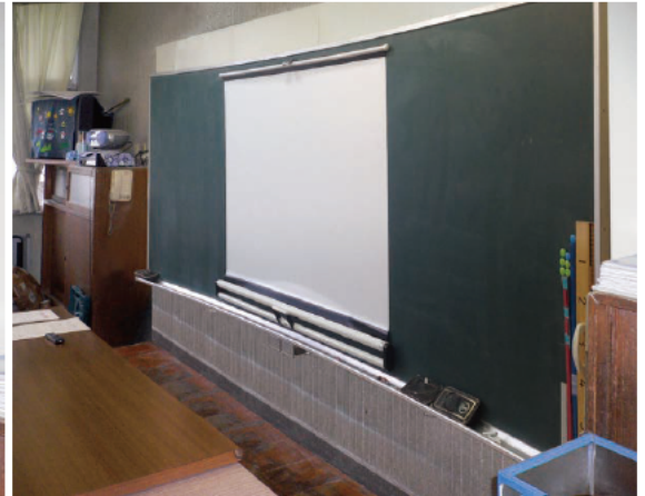
左:EEU-3612B1本体(黑板取付前) 上:曲面黑板取付時 弊社WSM-070WC-MV2 マグネット式スクリーン取付状態

平面・曲面黑板、ホワイトボードに適合。 装置本体が見えないので違和感も全くなし。