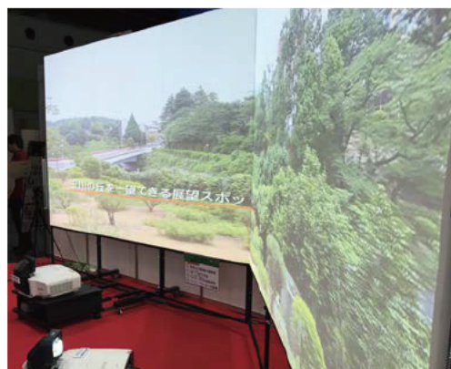
オープンキャンパス