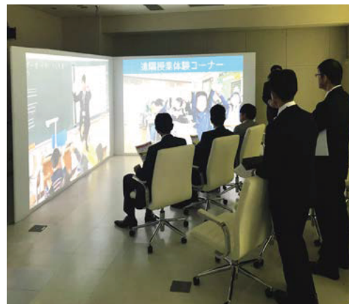
奈良県立教育研究所様