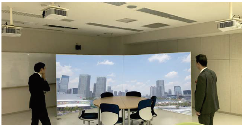
奈良県立教育研究所様