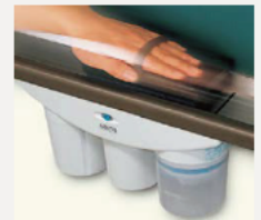
サイクロン式 電動ラーフルクリーナー