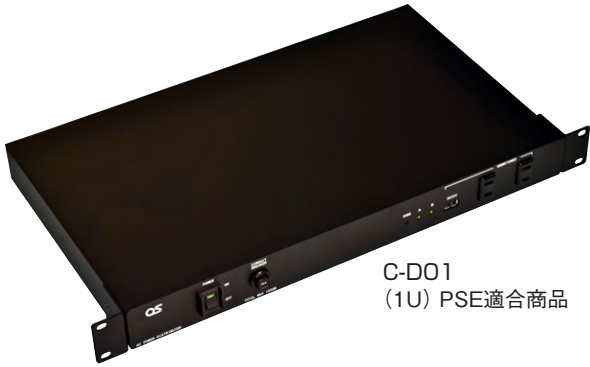
C-D01 (1U) PSE適合商品