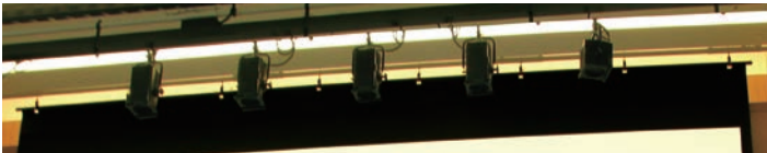
■多点吊のため高い平面性を確保