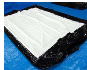
エアーを抜いた状態 (金具は一切ありません)