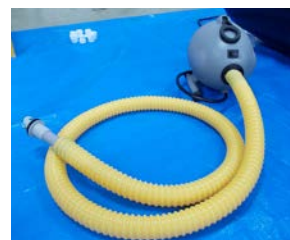
エアーポンプ (標準付属品OV-10)