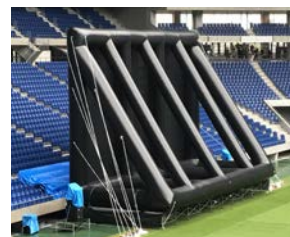
背面から見た状態